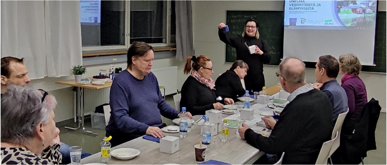
KUVA 3. Hankkeen loppuseminaari Askolassa

oli puheenvuorot myös hankkeeseen osallistuneilta tahoilta. Tilaisuudessa saatiin myös lisää kehittämisideoita suunnitelmaan ja tarkennettiin kehittämissuunnitelman karttamerkintöjä.