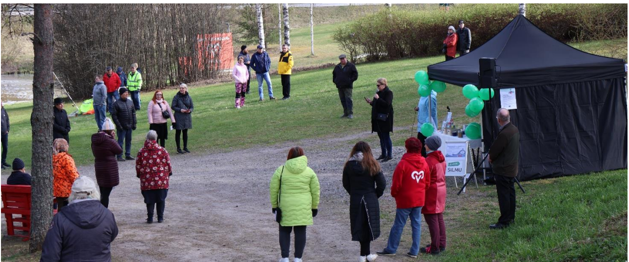
KUVA 2. Hankkeen kick off -tilaisuus Pukkilan Naarkoskella